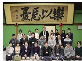
「いしかわ暮らし」の関心を喚起し、 いしかわの魅力に気づく。